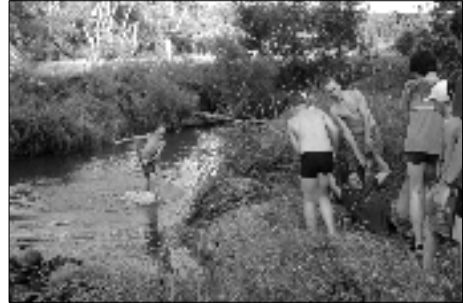
Keď vodcovia neposlúchajú ☹