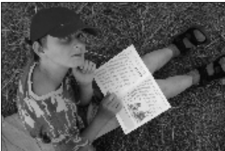
Nielen chlebom je človek živý