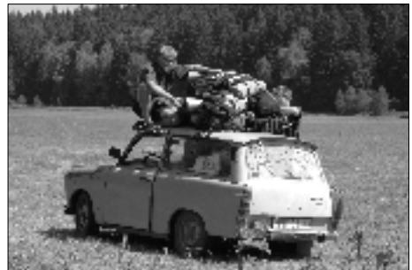
Takto to vyzerá, keď skauti cestujú.