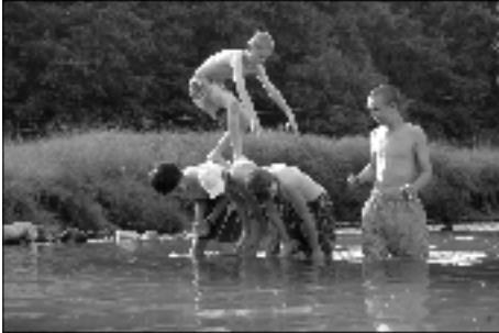
Ako prejsť suchou nohou cez vodu

Júl sa už stal tradične táborovým mesiacom aj pre 14. zbor Watomika v Prievidzi. Aj tento rok si postavili táborisko v lokalite Sklené pri Handlovej. Veľa vybavovačiek, ale prostredie nádherné. Vlastný program, samozrejme kuchyňa a celé zabezpečenie dávajú každoročne táboru to správne napätie. Sila bratstva a samozrejme i sesterstva je základom, aby všetko fungovalo, ako má. Ponúkame vám niekoľko momentov z tábora skautov, nabudúce svoje zážitky popíšu skautky.