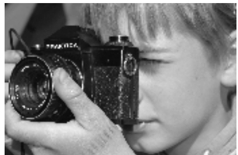
Nazeranie na svet cez hľadáček

Tak zas cez školský rok čaká všetkých poctivá príprava na júl 2007 a na nový tábor a nové dobrodružstvá.