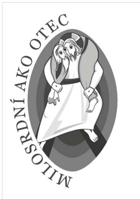
Oficiálne logo k Roku milosrdenstva

Večer milosrdenstva je moderovaná adorácia (piesne a sprievodné slovo, ktoré majú pomôcť k hlbšiemu prežívaniu vzťahu s Pánom v Eucharistii). Počas tejto adorácie bude možné prísť k svätej spovedi, alebo len jednoducho požiadať o modlitbu na váš úmysel.