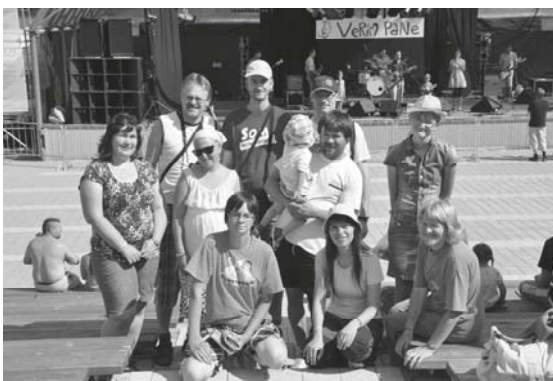
Skupina SPRAY a Prievidžania na festivale Verím Pane 2014

A keďže Verím Pane je hudobný festival, večery v amfiteátri pri Oravskej priehrade nám spríjemňo-