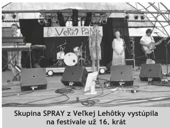
Skupina SPRAY z Veľkej Lehôtky vystúpila na festivale už 16. krát

Text: Lucia Bošková