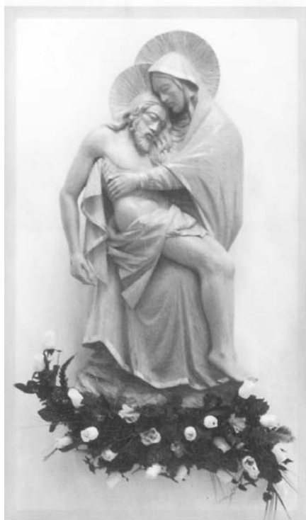
Sedembolestná Panna Mária

Dubnická Pieta má v sebe živého Ducha Viery, ktorý je v nej zašifrovaný samotným majstrom Pekarom. Mária je Matka a Vyvolená. Vyvolená Matka. Syn je Boží a Boží je Syn v plnosti. Ten, ktorého Mária drží vo svojom náručí, nie je „iba“ Božím. Ten, ktorý dočasne „spí“ na jej hrudi, je aj jej milované dieťa. Na pár bolestno-krásnych chvíľ patria navždy jeden druhému.