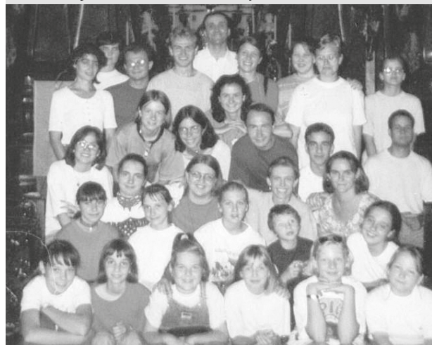
Bartolomejčatá v roku 1998 na výlete v Nitre