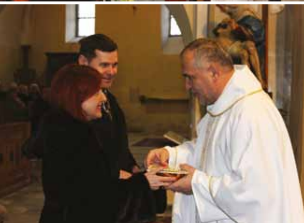
Svätá omša za mesto Prievidza a požehnanie Mestského úradu, 6. január 2018