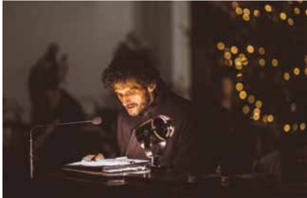
Polnočná svätá omša 24. decembra 2017 a slávnostná vianočná omša 25. decembra 2017 v Kostole Najsvätejšej Trojice v Prievidzi